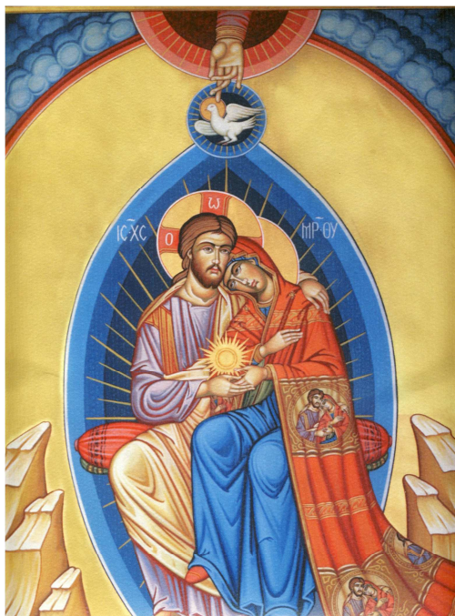
Kristus a Cirkev*

streda, 13. marec 2013, 13:30 - 16:00 hod. Kňazský seminár sv. Františka Xaverského v Badíne